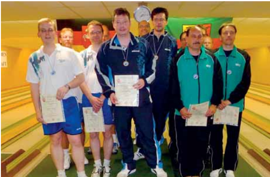
Herren-Mannschaft, v. l.: 2. Stade, 1. Hannover, 3. Peine.