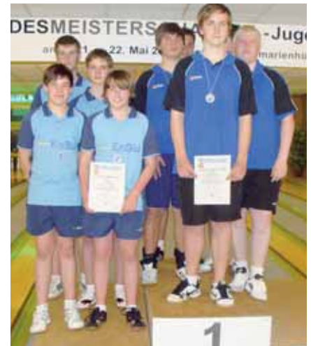
Männliche Jugend A Mannschaft, v. l. 2. VOK Osnabrück, 1. ESV Lingen.