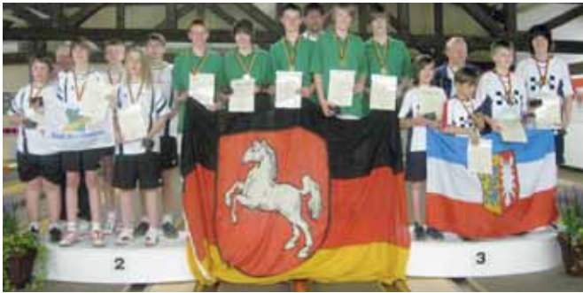
Mannschaft männliche Jugend B, v. l.: 2. JSG Nordenham, 1. SKV Bremervörde I, 3. VSK Stormarn.