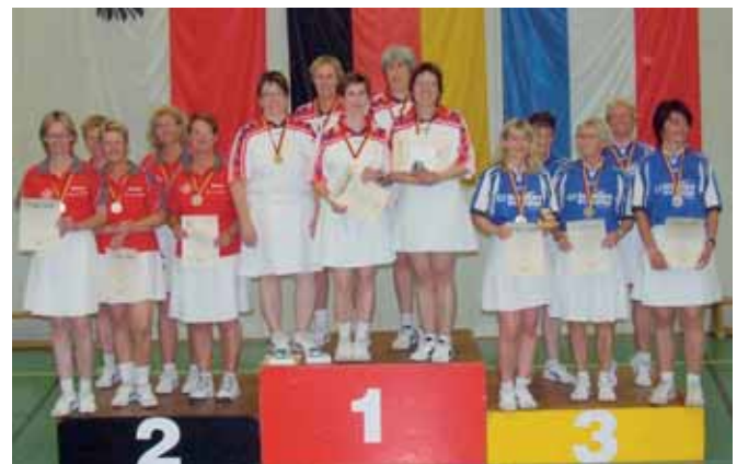
Damen-A-Mannschaft, v. l.: 2. Cuxhaven, 1. Bremen, 3. Husum.