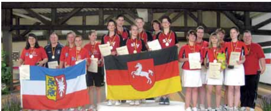
Mannschaft weibliche Jugend A, v. l.: 2. JSG Kiel, 1. SKV Bremervörde, 3. JSG Hamburg I.