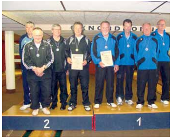
Herren-B-Mannschaft, v. I.: 2. VES Lingen, 1. VOK Osnabrück.