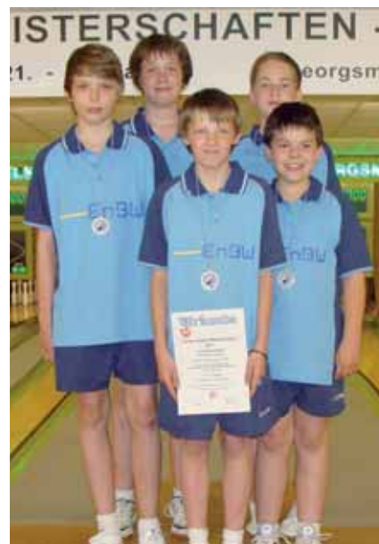
Männliche Jugend B Mannschaft: 1. VOK Osnabrück.