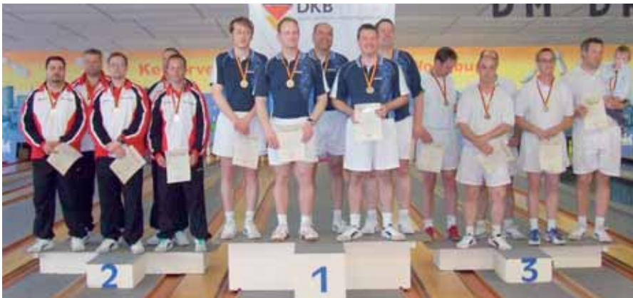
Herren-Mannschaft, v. l.: 2. Berlin, 1. Hannover, 3. Braunschweig.