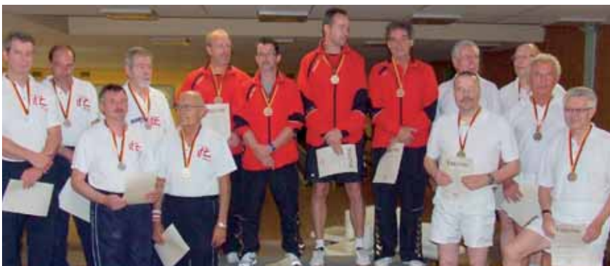
Herren-A-Mannschaft, v. l.: 2. Bielefeld I, 1. Kassel, 3. Braunschweig.