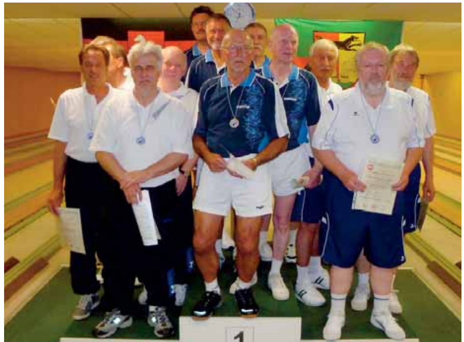
Herren-B-Mannschaft, v. l.: 2. Delmenhorst, 1. Hannover, 3. Celle.