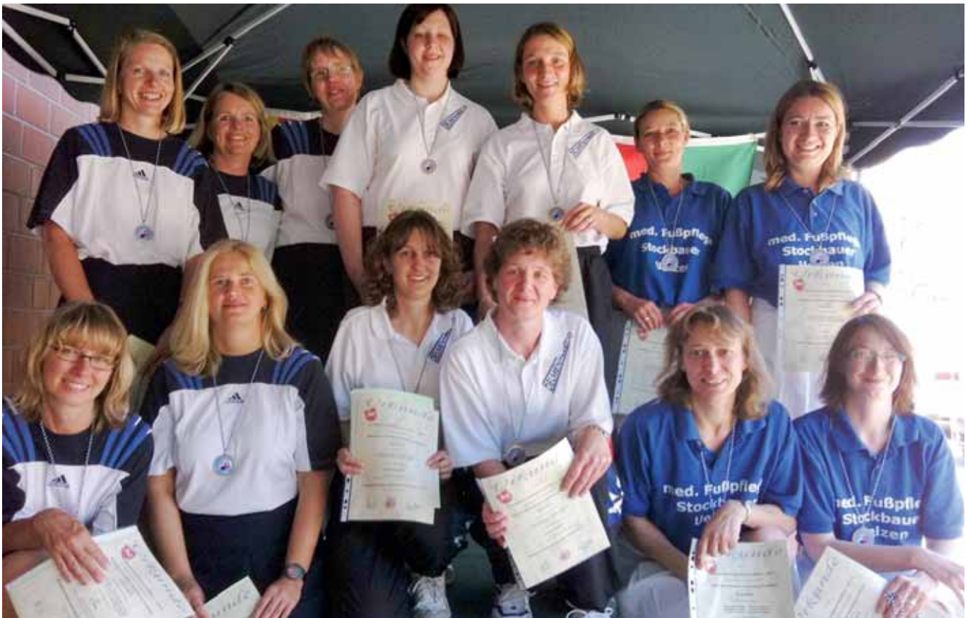
Damen-Mannschaft, v. l.: 2. Peine, 1. Delmenhorst, 3. Uelzen.