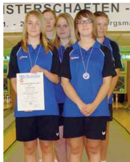
Weibliche Jugend A Mannschaft: 1. VES Lingen.