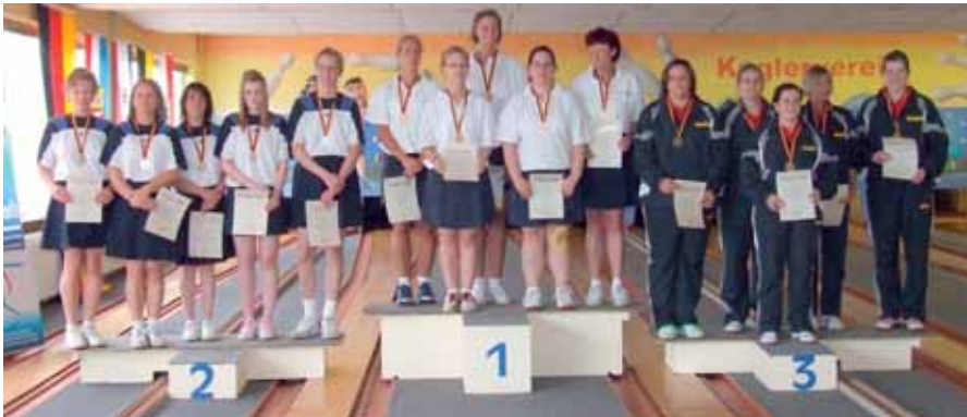
Damen-Mannschaft, v. l.: 2. Peine, 1. Hagen, 3. Hamburg I.