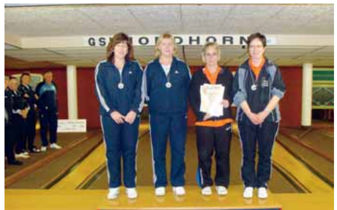
Damen-Mannschaft: 1. SKV Salzgitter.