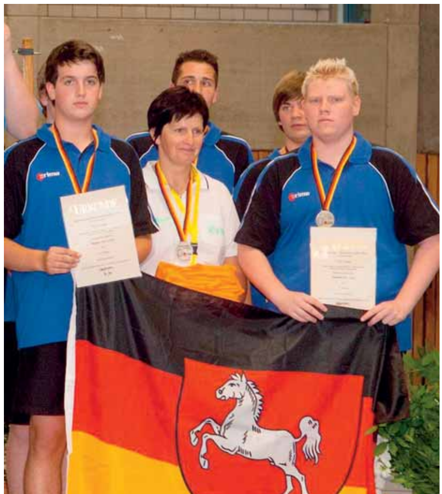
Die männliche A-Jugend des VES Lingen erkämpfte sich den Bronzerang.