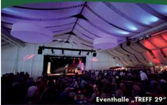
Eventhalle „TREFF 29“