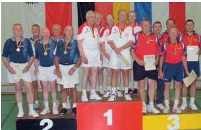
Herren-B-Mannschaft, v. l.: 2. Hannover, 1. Lübeck, 3. Stendal.