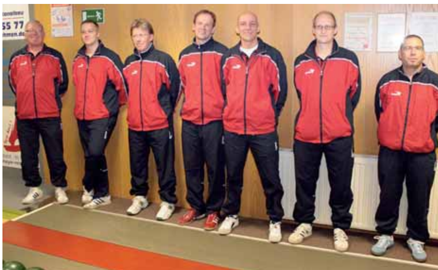
Das Herren-Aufgebot des KVN.