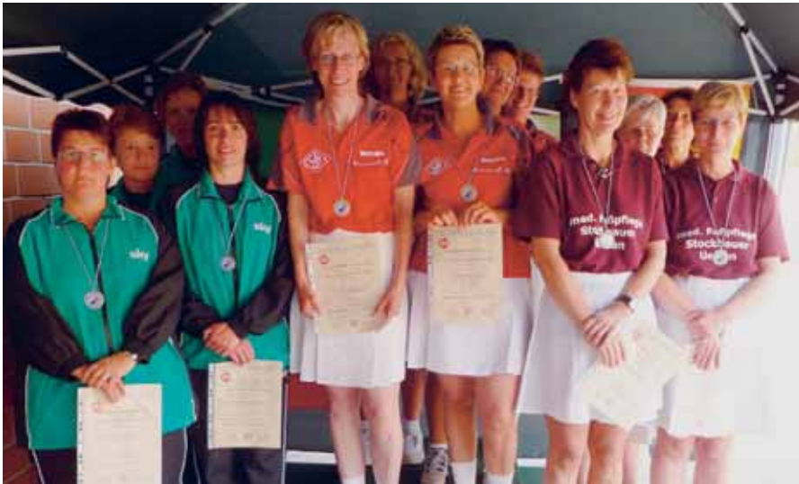
Damen-A-Mannschaft, v. l.: 2. Peine, 1. Cuxhaven, 3. Uelzen.