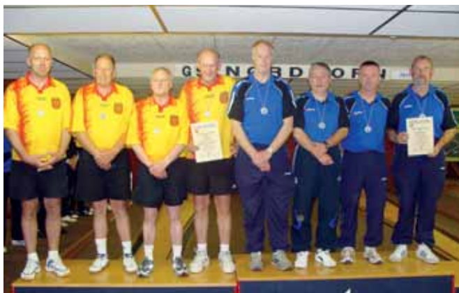
Herren-A-Mannschaft v. I.: 2. GSK Nordhorn, 1. VES Lingen.