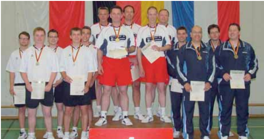
Herren-Mannschaft, v. l.: 2. Ostprignitz-Ruppin, 1. Kiel, 3. Hannover.