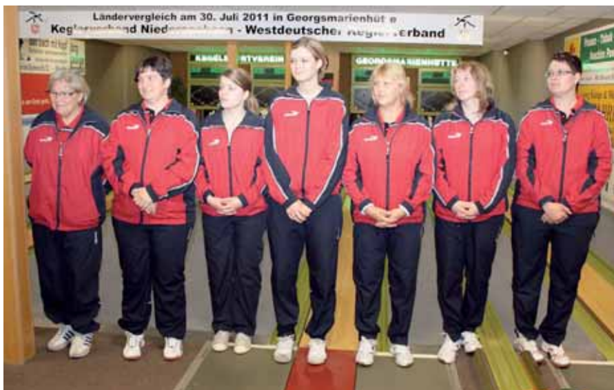
Das Damen-Aufgebot des KVN.