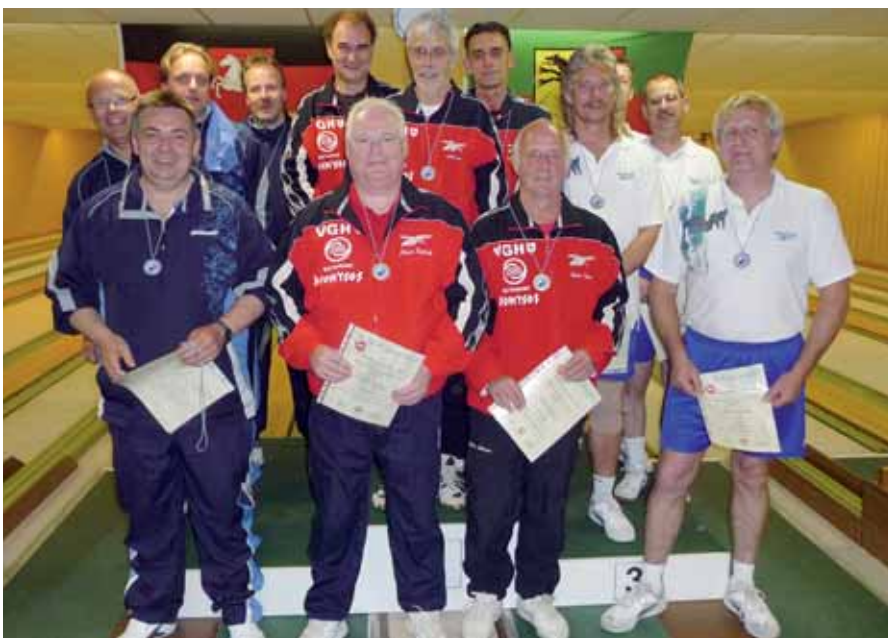
Herren-A-Mannschaft, v. l.: 2. Hannover, 1. Springe, 3. Stade.