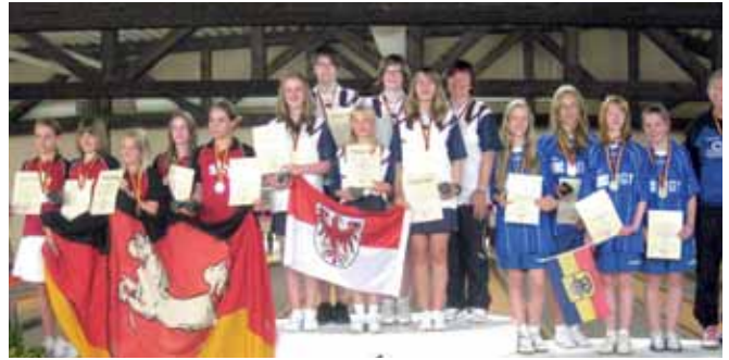
Mannschaft weibliche Jugend B, v. l.: 2. SKV Bremervörde, 1. KFV Dahme-Spreewald, 3. Güstrower KV.